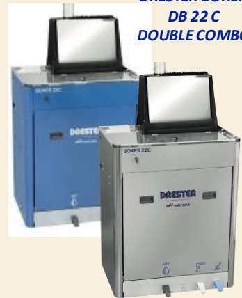
DRESTER BOXER DB 22 C DOUBLE COMBO