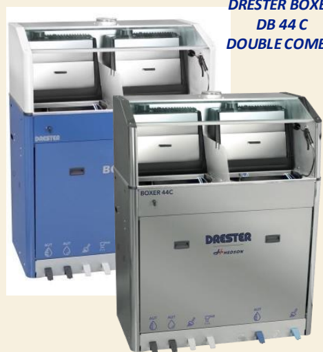
DRESTER BOXER DB 44 C DOUBLE COMBO